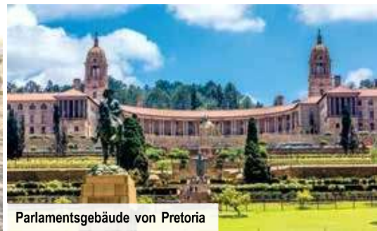
Parlamentsgebäude von Pretoria

und rutschsicheres Schuhwerk, da eine kurze Wanderung durch das Naturreservat unternommen wird. Bei Buchung der Erlebnis-Halbpension erfolgt das heutige Abendessen in einem lokalen Restaurant an der malerischen Waterfront zwischen Yachten und Einkaufsmöglichkeiten.