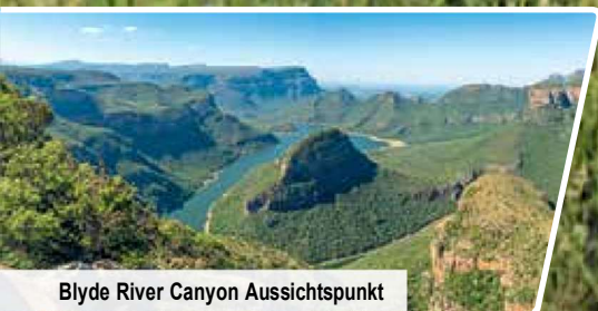
Blyde River Canyon Aussichtspunkt