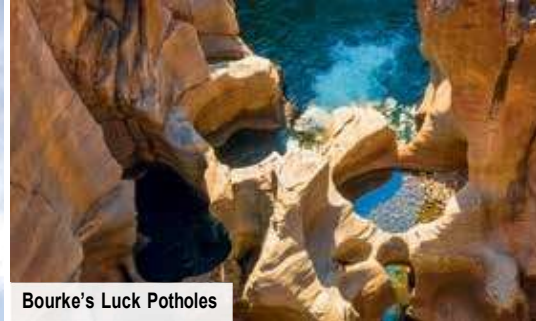
Bourke's Luck Potholes