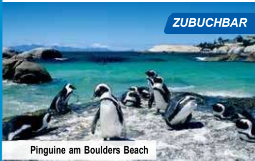
Pinguine am Boulders Beach