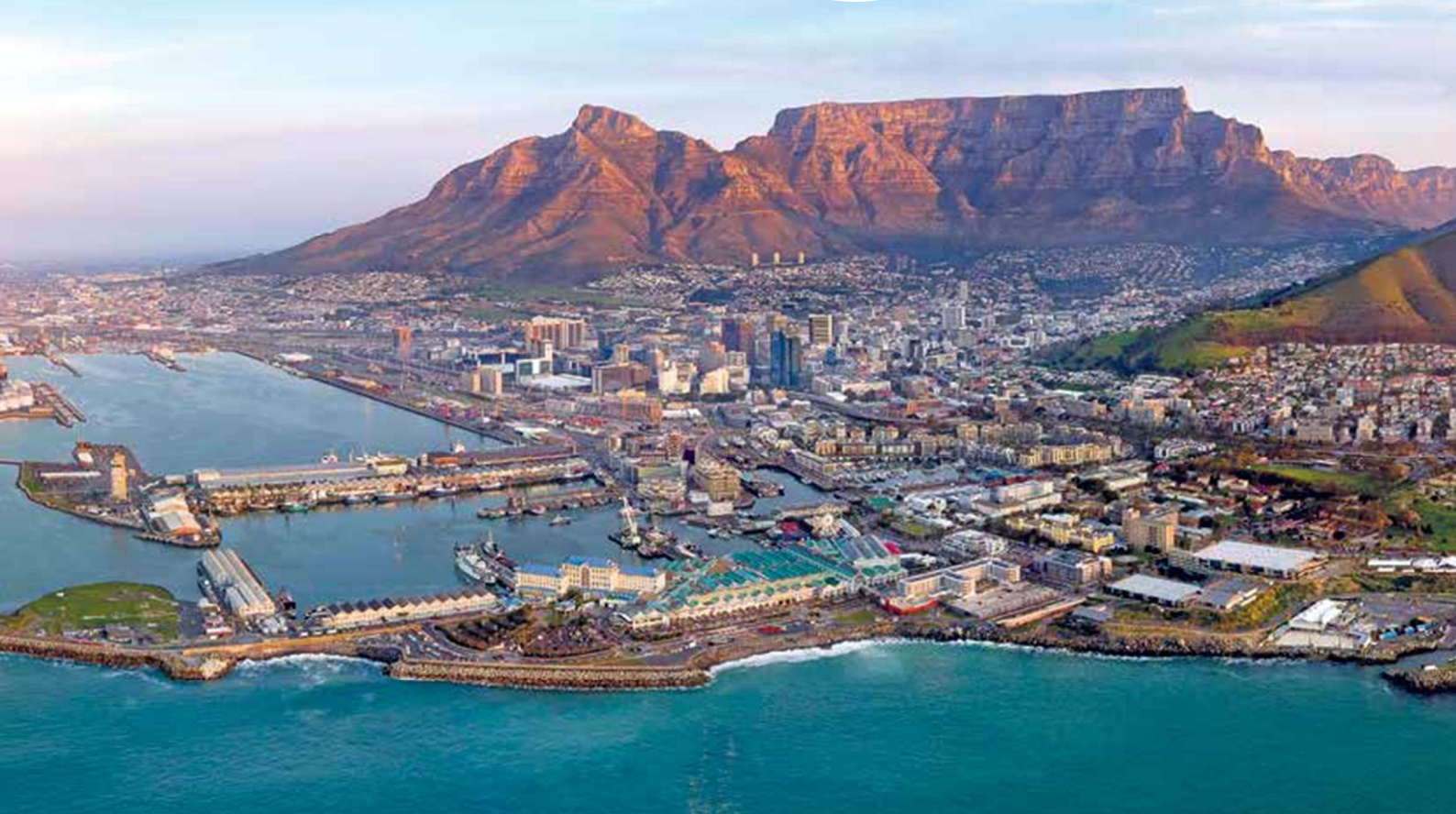
Blick auf Kapstadt