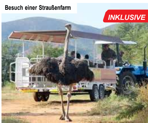
Besuch einer Straußenfarm