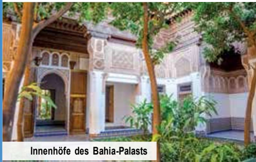
Innenhöfe des Bahia-Palasts