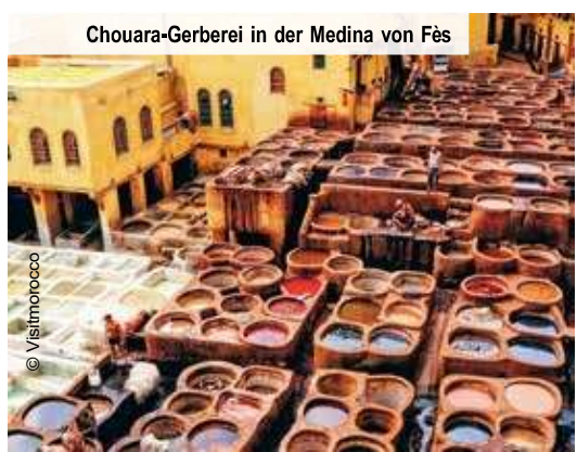
Chouara-Gerberei in der Medina von Fès

Nach dem Genuss Ihres Frühstücks im Hotel fliegen Sie heute zurück nach Hause.