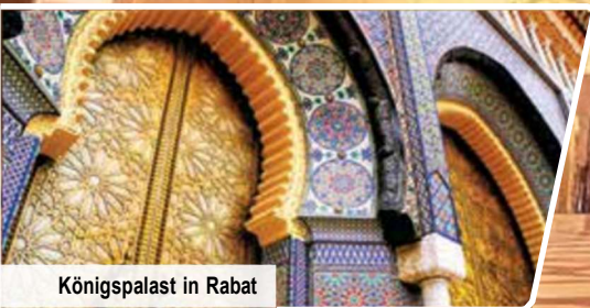
Königspalast in Rabat

Großes Ausflugsprogramm mit 7 UNESCO-Welterbestätten 4 Königsstädte Fès, Meknès, Marrakesch & Rabat Kulinarische Genuss-Halbpension