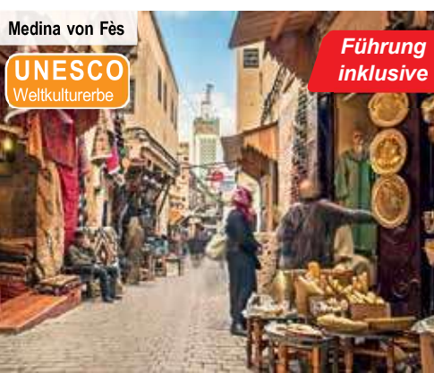
Medina von Fès