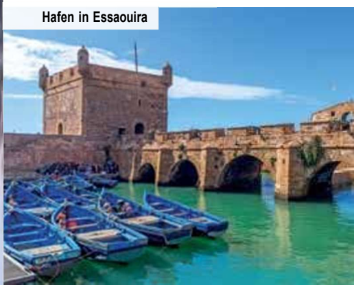
Hafen in Essaouira

Marrakesch wird Sie garantiert in Staunen versetzen. Sie sehen erst die Koutoubia-Moschee, die gleichzeitig die größte Moschee der Stadt und die älteste ganz Marokkos ist. Eindrucksvoll ist besonders das 77 Meter hohe Minarett der Moschee,