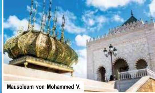
Mausoleum von Mohammed V.

INKLUSIVE Stadtbesichtigung von Rabat mit Mohammed-V.-Mausoleum, Hassan-Turm & Kasbah Oudaya