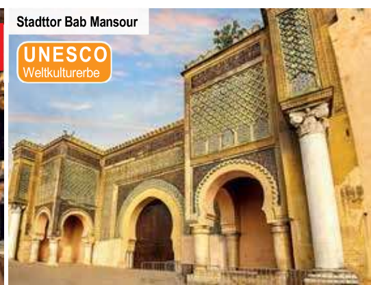
Stadttor Bab Mansour