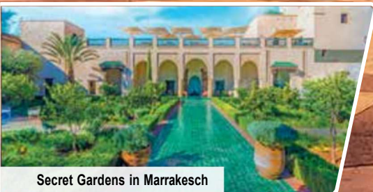
Secret Gardens in Marrakesch