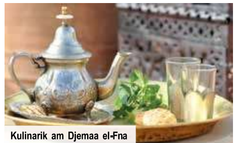
Kulinarik am Djemaa el-Fna

eines der Wahrzeichen der Stadt. Weiter geht es in die Menara-Gärten, eine etwa 100 Hektar große Oase der Ruhe. Danach erwartet Sie der Bahia-Palast, der bei einem Besuch von Marrakesch unbedingt auf dem Programm stehen sollte.