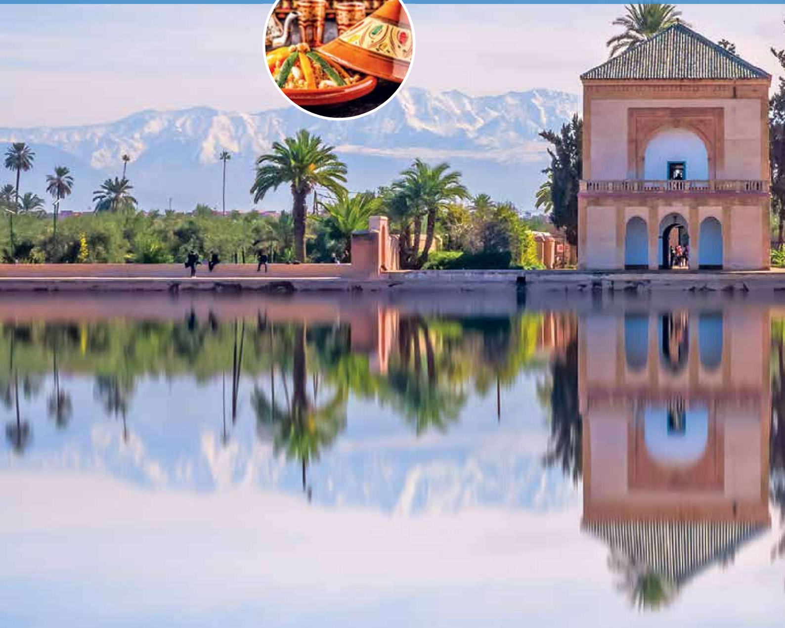
Saadian-Pavillon in den Menara-Gärten von Marrakesch