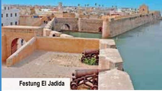
Festung El Jadida