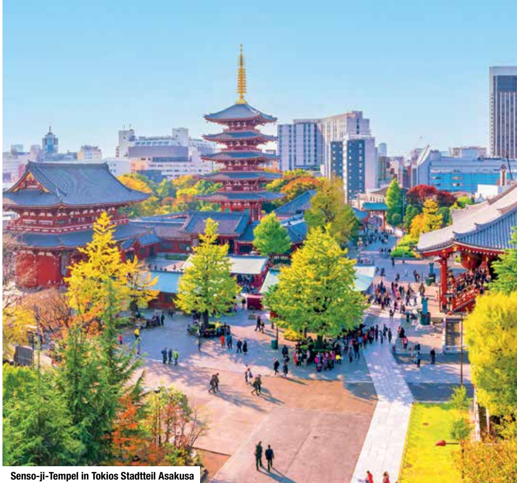
Senso-ji-Tempel in Tokios Stadtteil Asakusa