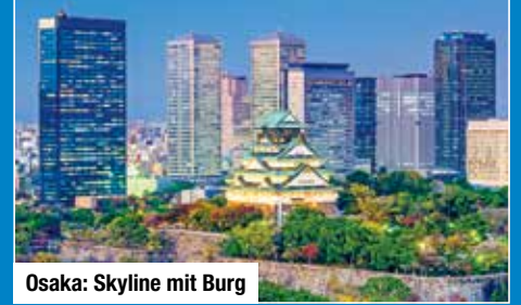
Osaka: Skyline mit Burg