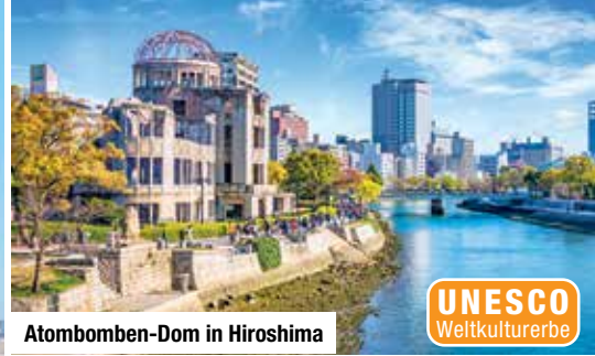
Atombomben-Dom in Hiroshima

Erkunden Sie die faszinierende Mega-Metropole Tokio mit u. a. dem Meiji-Jingu-Schrein, dem Stadtteil Asakusa, dem Tempel Senso-ji und dem Roppongi Hills Mori Tower.