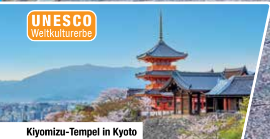
Kiyomizu-Tempel in Kyoto