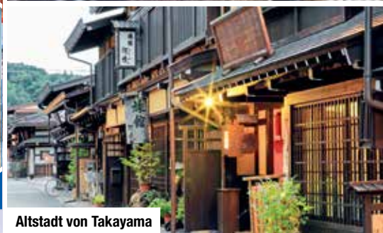
Altstadt von Takayama