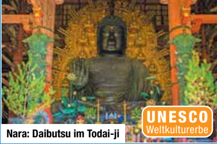
Nara: Daibutsu im Todai-ji