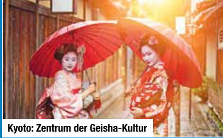
Kyoto: Zentrum der Geisha-Kultur