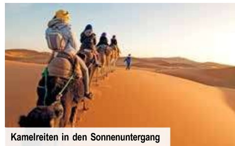
Kamelreiten in den Sonnenuntergang