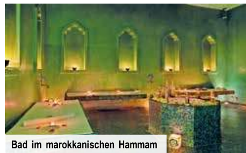
Bad im marokkanischen Hammam

Für Alleinreisende Einzelzimmer + € 35 p. N.