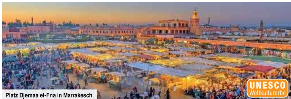
Platz Djemaa el-Fna in Marrakesch