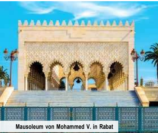
Mausoleum von Mohammed V. in Rabat