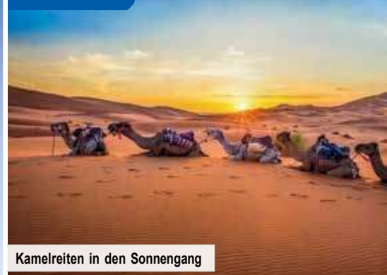
Kamelreiten in den Sonnengang