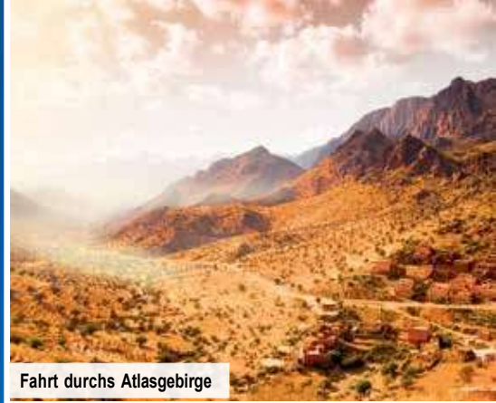
Fahrt durchs Atlasgebirge