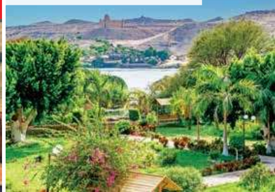
Botanischer Garten auf der Kitchener-Insel