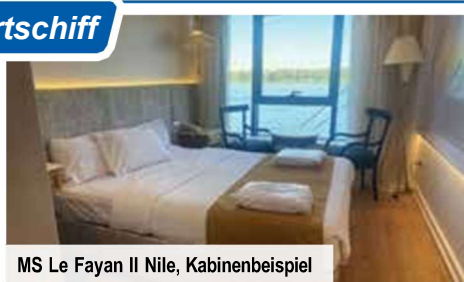
MS Le Fayen II Nile, Kabinenbeispiel