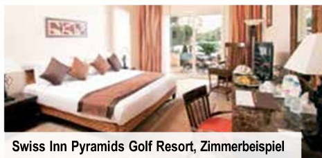
Swiss Inn Pyramids Golf Resort, Zimmerbeispiel