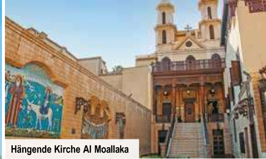
Hängende Kirche Al Moallaka

Erleben Sie das letzte Weltwunder der Antike, die beeindruckenden Pyramiden von Gizeh, sowie die imposanten Welterbe-Tempel Luxor & Karnak!