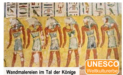
Wandmalereien im Tal der Könige