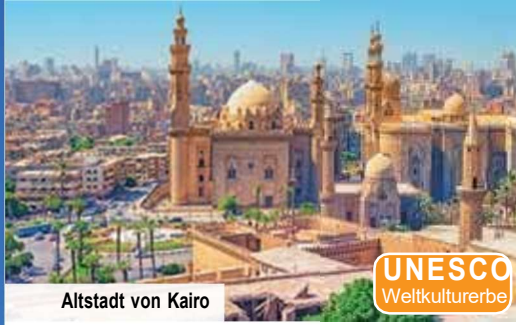
Altstadt von Kairo