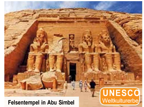
Felsentempel in Abu Simbel

Ausflug nach Abu Simbel (UNESCO-Weltkulturerbe) zu den einzigartigen Felsentempeln und Baudenkmalern der Antike zu Ehren Ramses II. und seiner Gemahlin Nefertari € 169 p. P. Bei Vorabbuchung sparen Sie € 20 p. P. € 149 p. P.