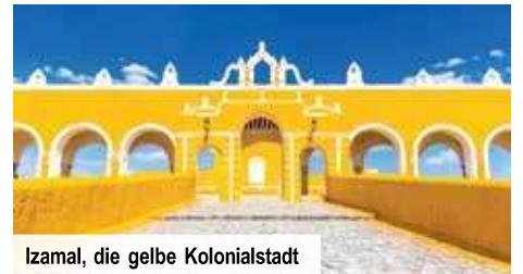
Izamal, die gelbe Kolonialstadt

Als besonderen Programmpunkt besuchen Sie einen der bunten Märkte der Stadt und freuen sich auf ein Feuerwerk an Farben, Gerüchen und Aromen. Ein Einheimischer erklärt Ihnen die Geheimnisse