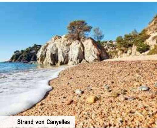
Strand von Canyelles