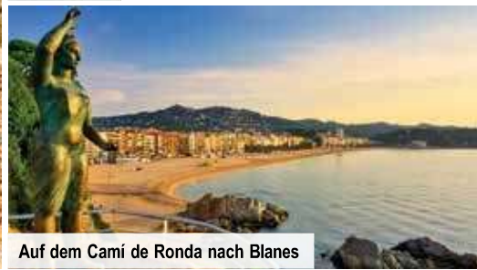
Auf dem Cami de Ronda nach Blanes