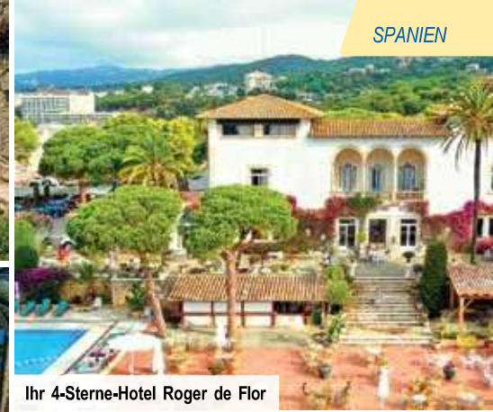
Ihr 4-Sterne-Hotel Roger de Flor