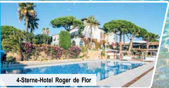
4-Sterne-Hotel Roger de Flor

8-tägige Flugreise statt ab € 899 jetzt ab p.P. € 699 Sie sparen € 200 p.P. nur mit zeitlich befristetem Aktions-Code