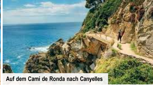
Auf dem Cami de Ronda nach Canyelles