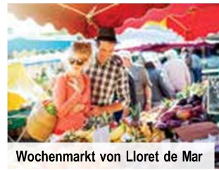
Wochenmarkt von Lloret de Mar

Doppelzimmer zur Alleinbenutzung + € 30 p. N.